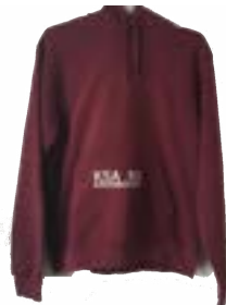
KSA ROO PULL BORDEAUX