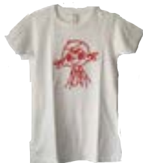
KSA ROO T-SHIRT WIT