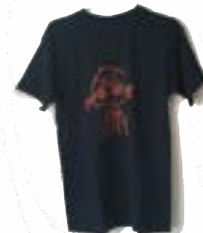
KSA ROO T-SHIRT DONKERBLAUW