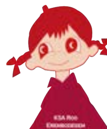
KSA ROO SCHILDJE